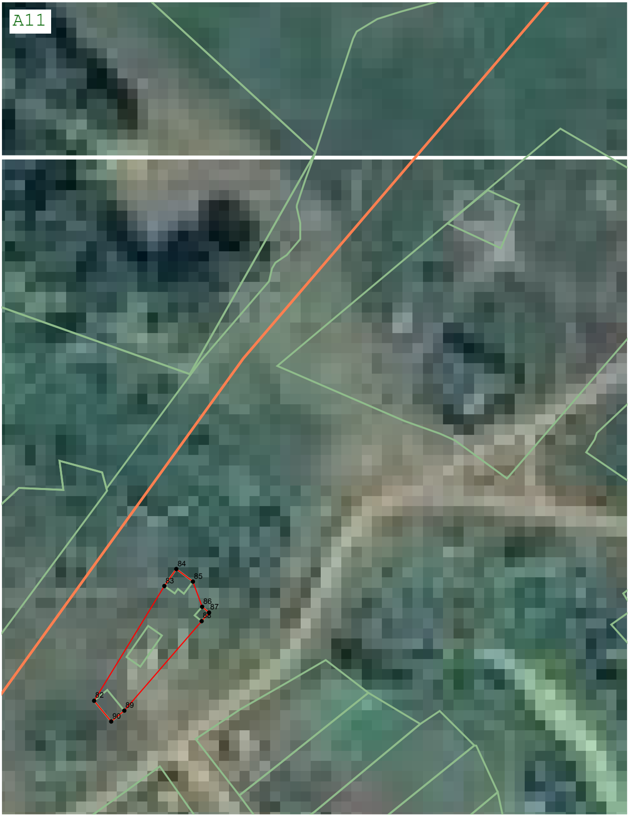
Масштаб 1:2 000

Подпись Вячеслав Олегович Дата « 19 » августа 20 22 г.